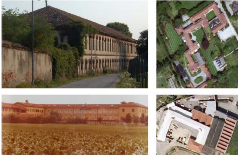
Εικόνα 2: Φωτογραφίες από 4 πρώην υφιστάμενα βιομηχανικά κτήρια 3

Ο κύριος στόχος της διαδικασίας αυτής είναι να προσδιορίσουμε την καταλληλότητα των βιομηχανικών κτηρίων επιλέγοντας εκείνο που έχει τις καλύτερες προοπτικές αξιοποίησης. Τα κριτήρια για την επιλογή είναι: