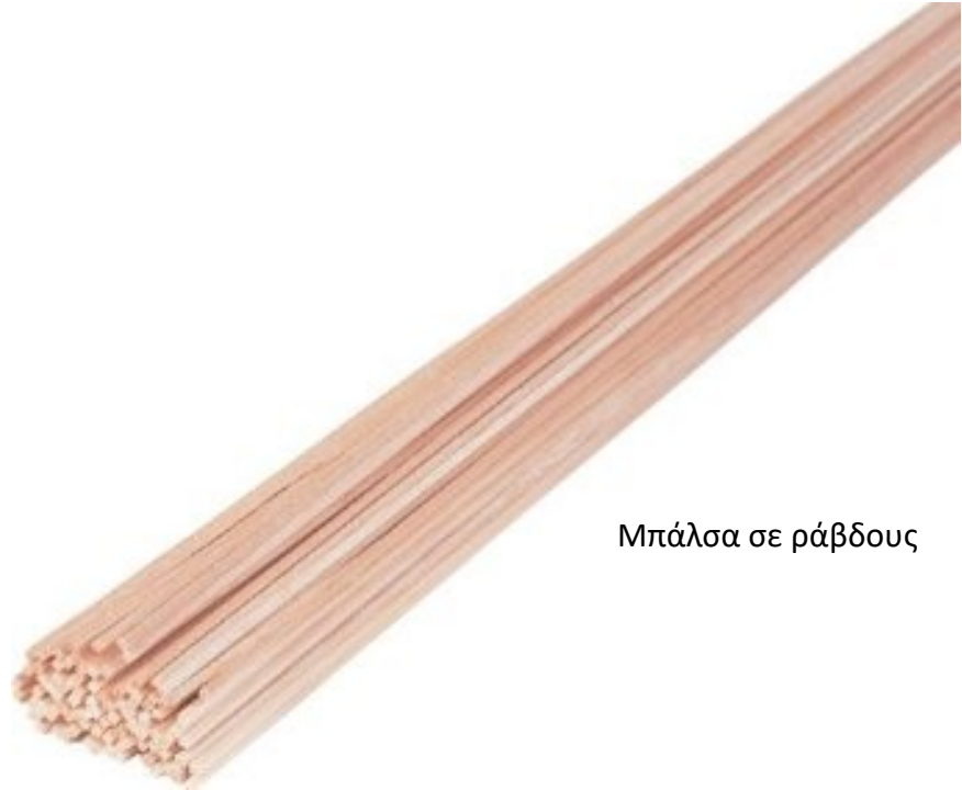
Μπάλα σε ράβδους