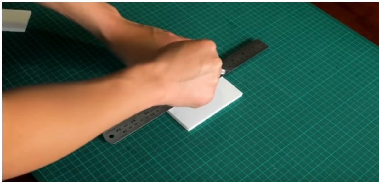
Επιφάνεια κοπής και μεταλλικός χάρακας