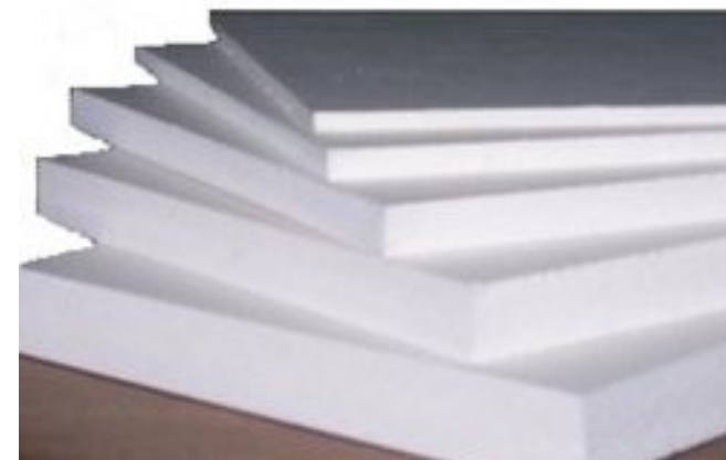
Χαρτόνι λευκό (μακετόχαρτο)