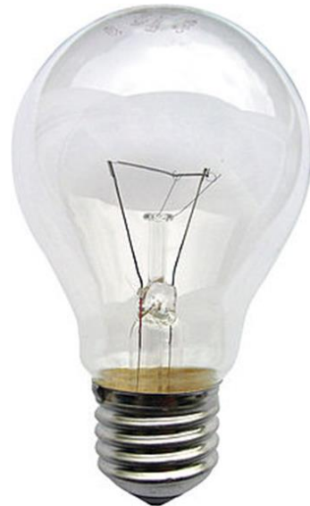
Σχήμα 1. Τυπικός λαμπτήρας πυράκτωσης

Κύρια αιτία φθοράς και "θανάτου" του λαμπτήρα πυράκτωσης είναι η εξάχνωση του βολφραμίου του νήματος του οποίου προοδευτικά το πάχος μειώνεται μέχρις ότου να αποκοπεί στο σημείο όπου είναι ασθενέστερος. Το βολφράμιο εξαχνούμενο μεταφέρεται και επικάθεται στα ψυχρότερα σημεία της φύσιγγας. Αυτή είναι και η αιτία του μαυρίσματος του λαμπτήρα. Η εξάχνωση αυτή είναι ταυτόχρονα και η αιτία να εμποδίζεται η αύξηση της θερμο-