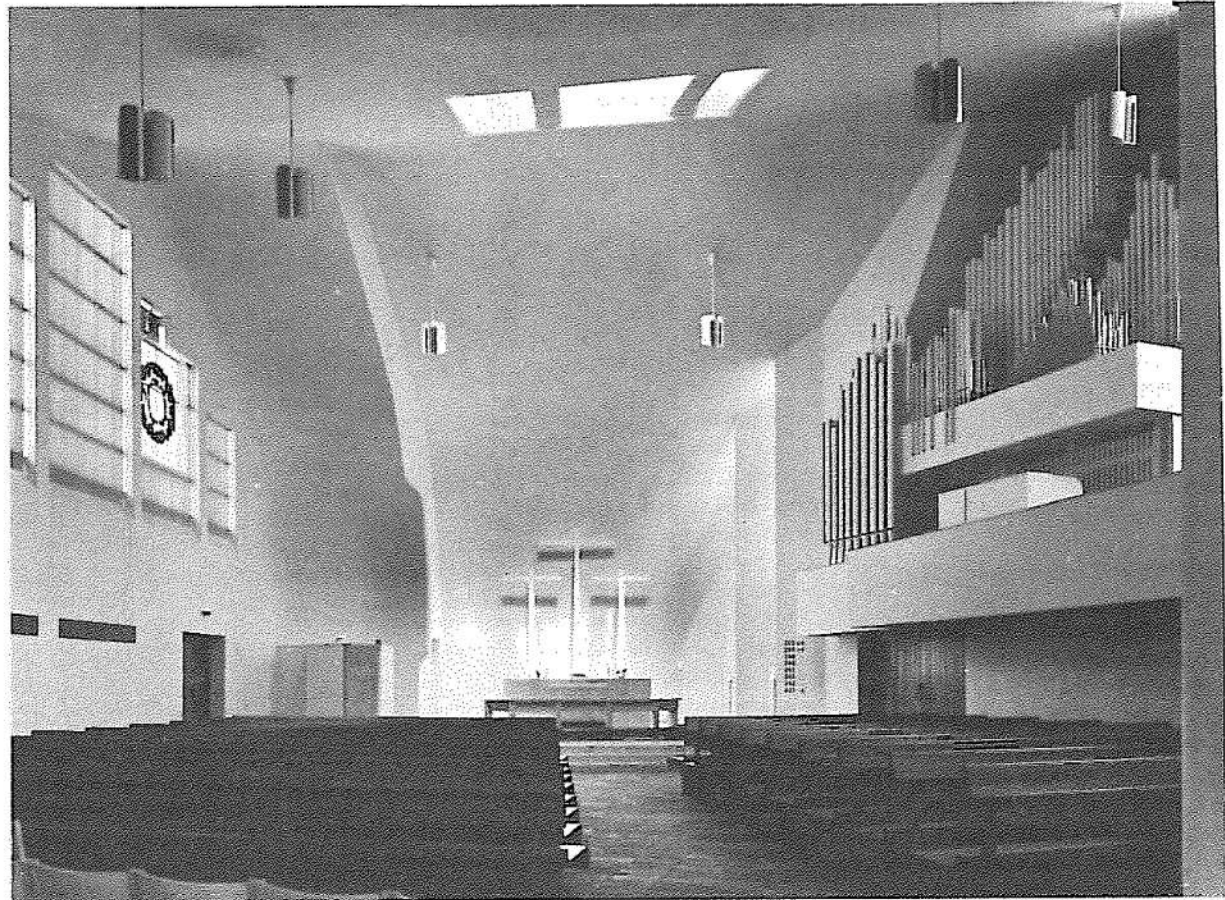
3. Aalto. Έκκλησία, Vuoksenniska, κοντά στην Imatra

Ή έφεση για μιά πολύπλοκη αρχιτεκτονική, μέ τίς άντιφάσεις πού τήν πλαισιώνουν, δέν είναι μονάχα άντίδραση στην πεζότητα ή μικρότητα τής τρέχουσας αρχιτεκτονικής.