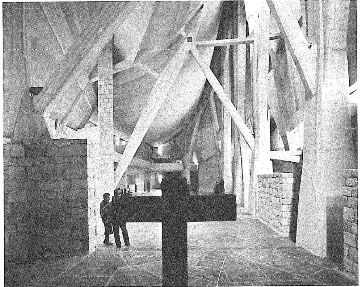
4. Michelucci. 'Εκκλησία για την Autostrada, κοντά στη Φλωρεντία

Δεύτερο, πρέπει να σημειώσουμε τις αυξανόμενες πολυπλοκότητες των λειτουργικών μας προβλημάτων. Αναφέρομαι, φυσικά, σ' αυτά τα προγράμματα, χαρακτηριστικά της εποχής μας, που λόγω των διαστάσεών τους είναι τόσο πολύπλοκα, όπως τα εργαστήρια έρευνας, τα νοσοκομεία και κυρίως τα γιγαντιαία έργα σε κλίμακα μιάς πόλης ή μιάς περιοχής. Αλλά ακόμη και ένα σπίτι, με τα περιορισμένα του πλαίσια, είναι πολύπλοκο στο σκοπό του, εάν θέλουμε να εκφράσουμε το διαφορούμενο της σύγχρονης ζωής. Αυτή η αντίθεση μεταξύ των μέσων και των στόχων του προγράμματος είναι σημαντική. Στο πρόγραμμα για την αποστολή πυραύλου στη σελήνη, αν και τα μέσα που διαθέτει το πρόγραμμα είναι αφάνταστα πολύπλοκα, ο τελικός στόχος είναι απλός και είναι λίγες οι αντιφάσεις του. Στο πρόγραμμα και τη δομή κτιρίων, αν και τα μέσα είναι πολύ απλούστερα και τεχνολογικά λιγότερο εξελιγμένα απ' όποιοδήποτε τεχνικό έργο, ο τελικός στόχος είναι περισσότερο πολύπλοκος και σε πολλές περιπτώσεις διαφορούμενος στην ουσία του.