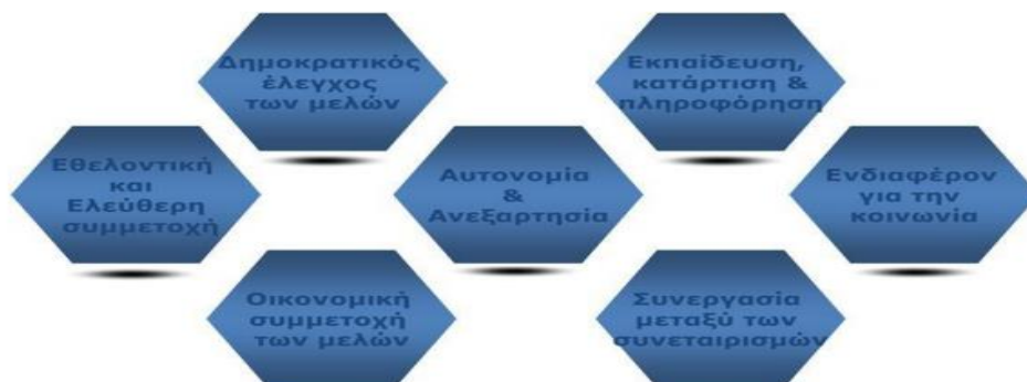
Εικόνα 1: Οι Συνεταιριστικές Αρχές

Συζητούν στην ομάδα και καταγράφουν τις επτά (7) Διεθνείς Συνεταιριστικές Αρχές.